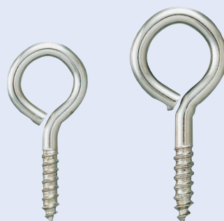
鉄ニッケルメッキ