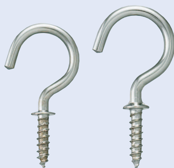
鉄ニッケルメッキ