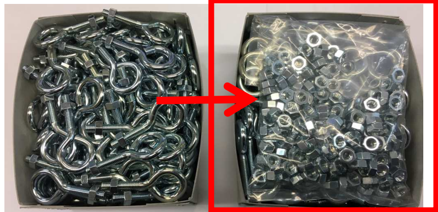
従来品 Rohs非対応 ナット組込