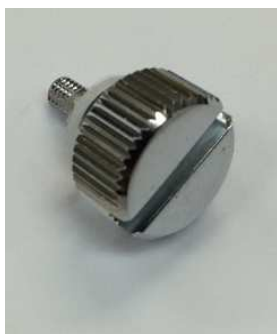
真鍮クロム BRBS バフ