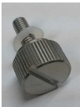
ステンレスSRBS ヘアライン

本体: 真鍮 表面処理: 頭部 バフ クロームメッキ 付属品: ナイロンワッシャ